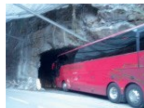
Essais de gabarit le 25/01/2017

Les unités de la gendarmerie sont chargées de gérer le passage des véhicules >3,5t et des véhicules transportant des matières dangereuses. Ils devront emprunter le tunnel un par un. Cela pourrait engendrer des ralentissements.