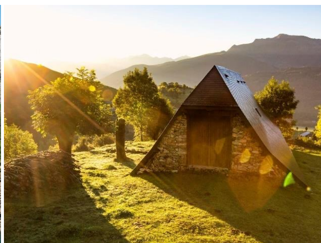
Copyright : ©Pierre Meyer et ©Antoine Garcia - Vallées de Gavarnie